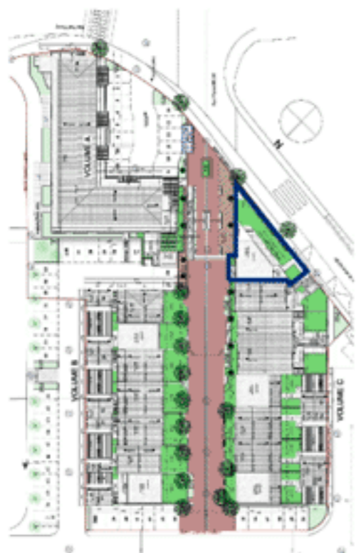
Positionnement sur plan de masse

— Pleine propriété - - - - - Jouissance privative