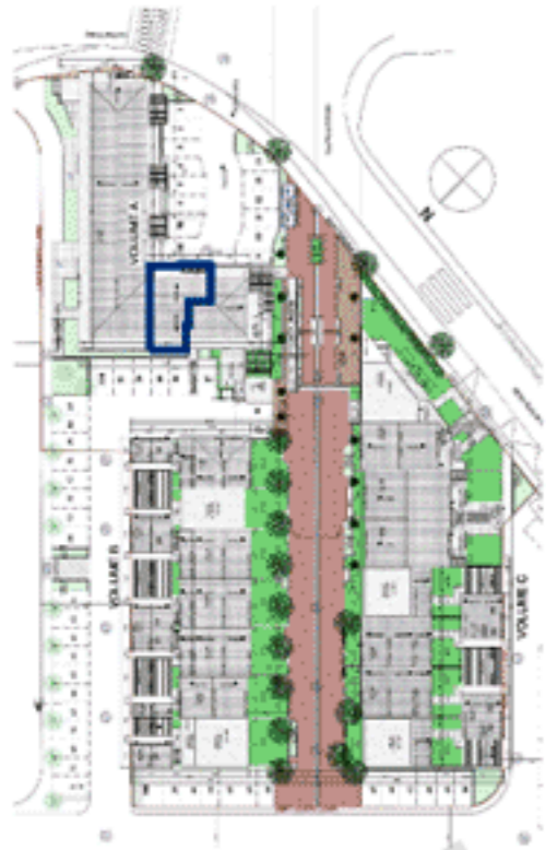
Positionnement sur plan de masse