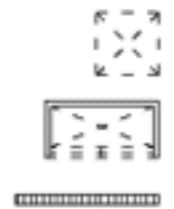
Tableau électrique Coffre de volet roulant Gaine technique Faux plafond

Élément de cuisine dessiné à titre indicatif Placard dessiné à titre indicatif Protection solaire fixe