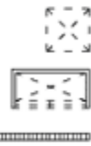
Tableau électrique Coffre de volet roulant Gaine technique Faux plafond

Élément de cuisine dessiné à titre indicatif Placard dessiné à titre indicatif Protection solaire fixe