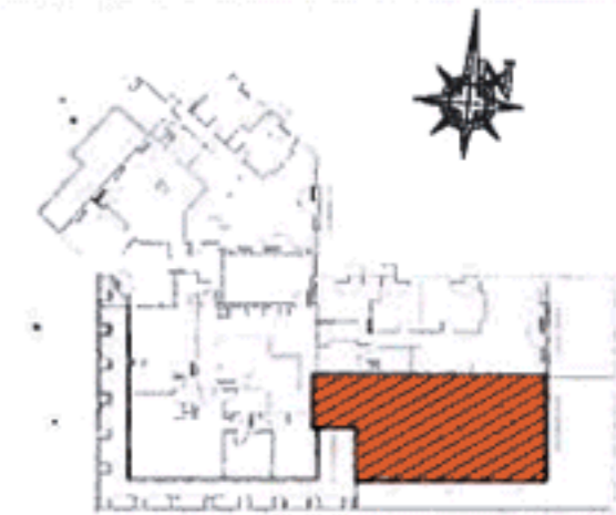
PLAN DE RÉPERAGE