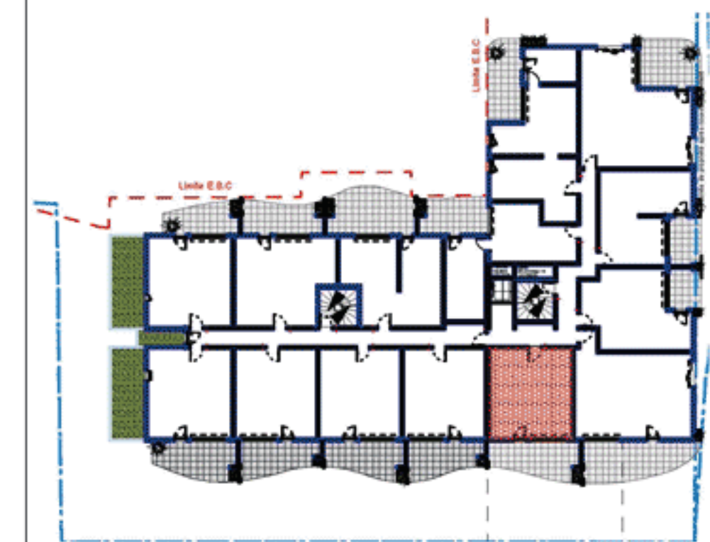
Plan de situation dans l'immeuble