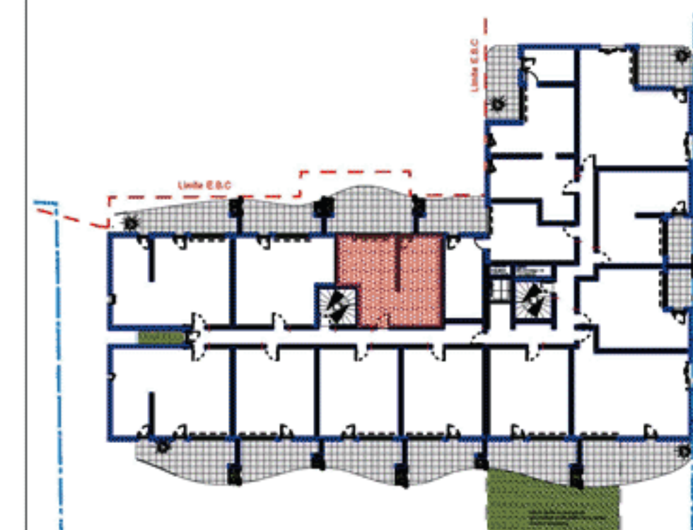
Plan de situation dans l'immeuble