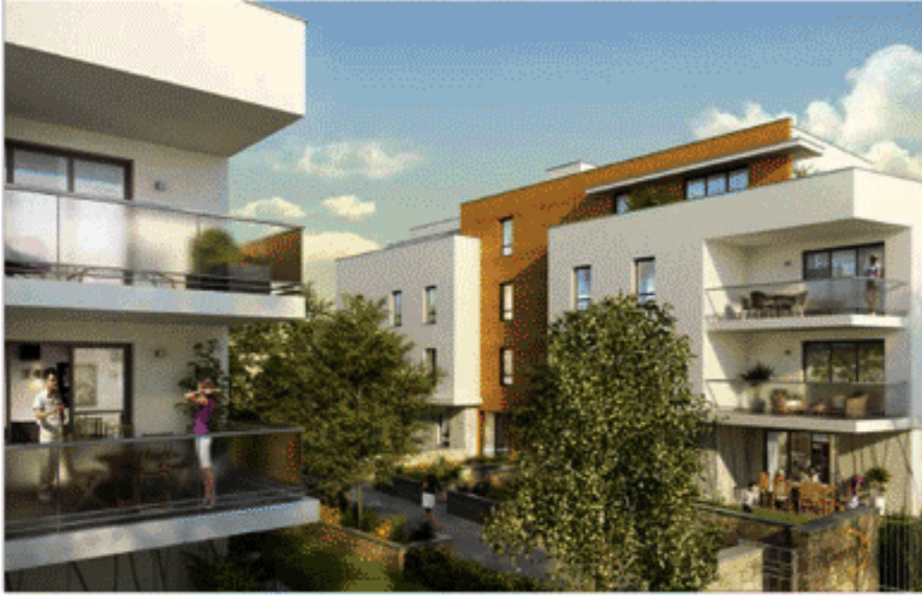
Plan de Vente