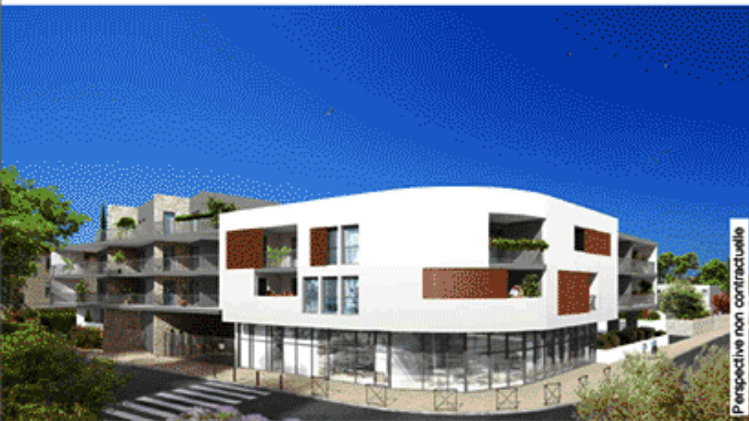
Perspective non contractuelle