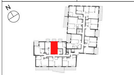
TABLEAU DE SURFACE