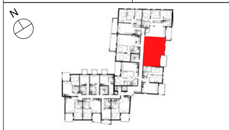
TABLEAU DE SURFACE