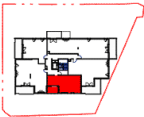
Tableau de Surface