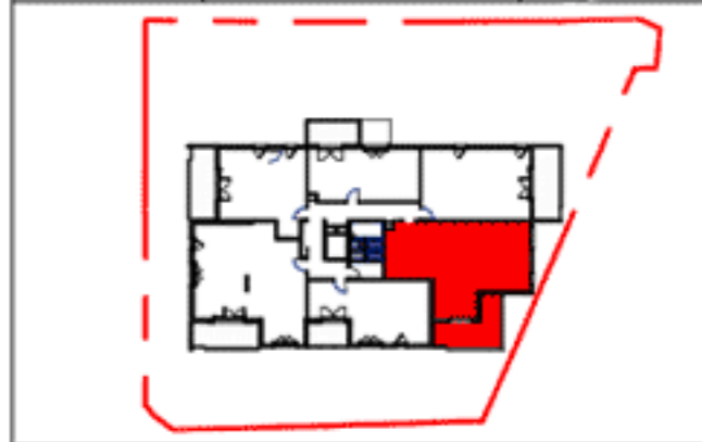
Tableau de Surface