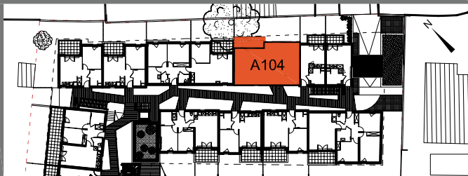
T3 - 1er étage